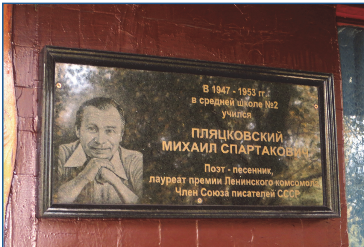
Мемориальная доска, посвященная Михаилу Пляцковскому, на здании ОШ № 2